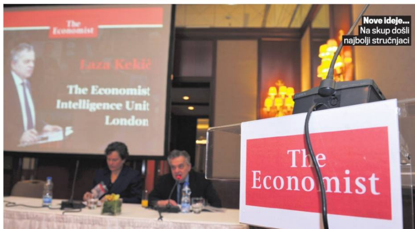
Nove ideje... Na skup došli najbolji stručnjaci