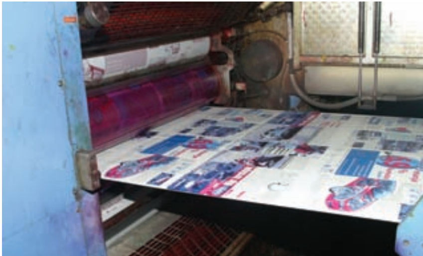
Cilj novog serijala e magazina je da pomogne i ohrabri buduće izdavače

novinskih kuća, poput Politike, BIGZ-a i Borbe u Beogradu, Vijesnika u Zagrebu i sličnih socijalističkih medijskih mastodonata u prestonicama ostalih republika. Drugi nivo bile su regionalne i lokalne novine sa lokalnim samoupravama kao izdavačima, a treći – brojne novine koje su izdavala razna udruženja građana (književnika, golubara, numizmatičara), savezi (komunista, studenata, omladine...) i ostali članovi SSRNJ (Soc-saveza). Jedini izuzetak bili su možda mediji u vlasništvu crkava (Pravoslavlje, Glas koncila i sl.), ali i tu je reč bila o moćnim organizacijama sa velikim i fleksibilnim budžetom, spremnim da istupi i višegodišnje poslovanje u minusu.