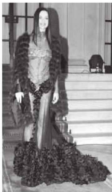
Severina pokazala savršenu figuru

Dogadaj "Ličnost godine", koji drugu godinu zaredom organizuje magazin "Hello", sinoć je održan u Belom dvoru. Statuete su dobili najuspešniji iz oblasti sporta, muzike, pozorišta, filma, mode i televizije.