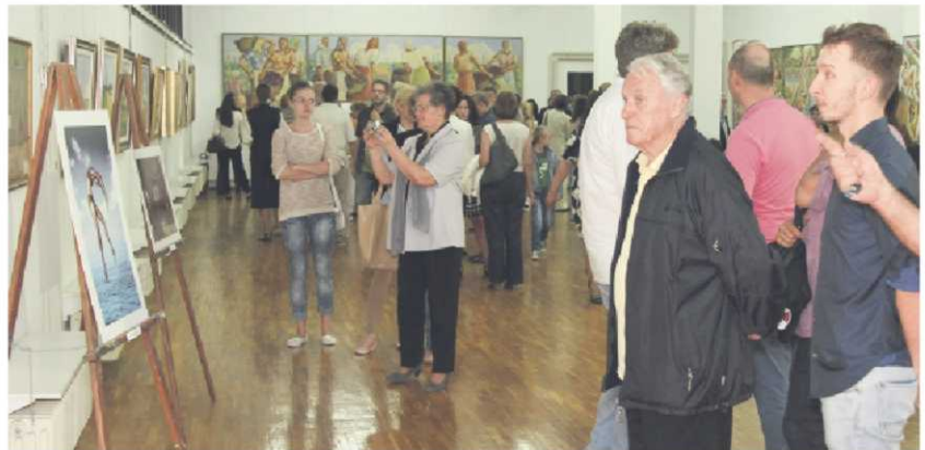
И Сава Шумановић би подржао ове фотографске реминисценције